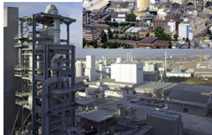
und im Werk Amöneburg der Dyckerhoff GmbH

Im Industriepark Kalle-Albert betreiben die Unternehmen Archroma Germany GmbH, Allnex Germany GmbH, InfraServ GmbH & Co. Wiesbaden KG, Kalle Group, Knettenbrech + Gurdulic IndustrieService GmbH, SE Tylose GmbH & Co. KG und WeylChem Wiesbaden GmbH Anlagen,