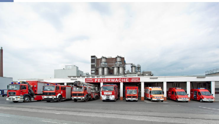
Werkfeuerwehr InfraServ Wiesbaden

Die beiden Werkfeuerwehren des Industrieparks Kalle-Albert und der Dyckerhoff GmbH sorgen dafür, dass alle erforderlichen Maßnahmen getroffen werden, um die Nachbarn zu warnen und die Auswirkungen des Ereignisses so gering wie möglich zu halten.